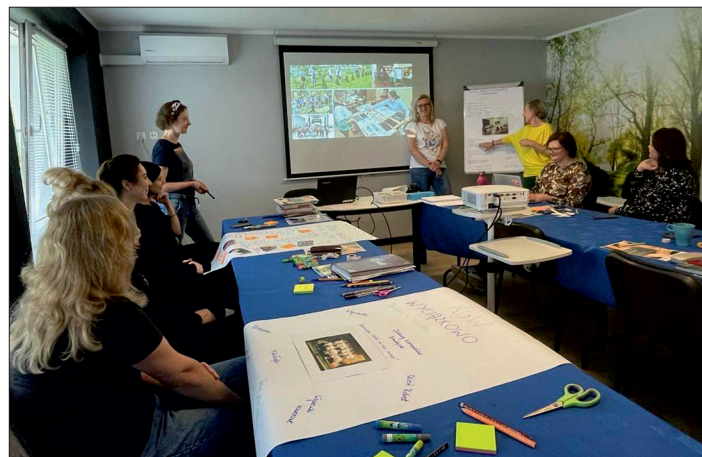
Blisko - szkolenie z Partnerami.

waliśmy wspólne działania. W ramach projektu działaMY organizujemy dla mieszkańców bezpłatne warsztaty i spotkania. Szczegóły na na-