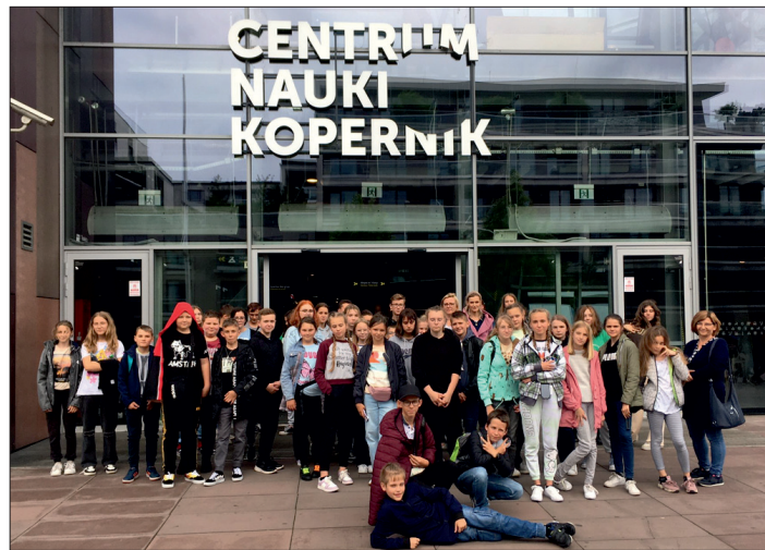
Przed Centrum Nauki „Kopernik” w Warszawie.