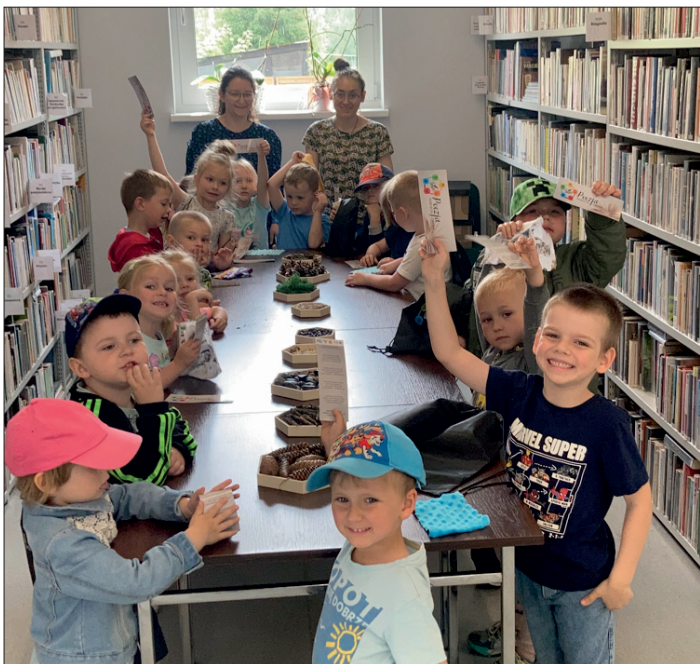
Poezja pobudza zmysły - warsztaty sensoryczne.

W ramach projektu odbył się również piknik międzypokoleniowy w gospodarstwie „Kraina Dudusia Wesółka” w Górcie Duchownej. Tematyką pikniku były smaki i zapachy dzieciństwa. Dzieci dowiedziały się jak powstaje masło i same mogły spróbować swoich sił przy jego produkcji. Smak pieczonego na płycie „Angielki” chleba z masłem