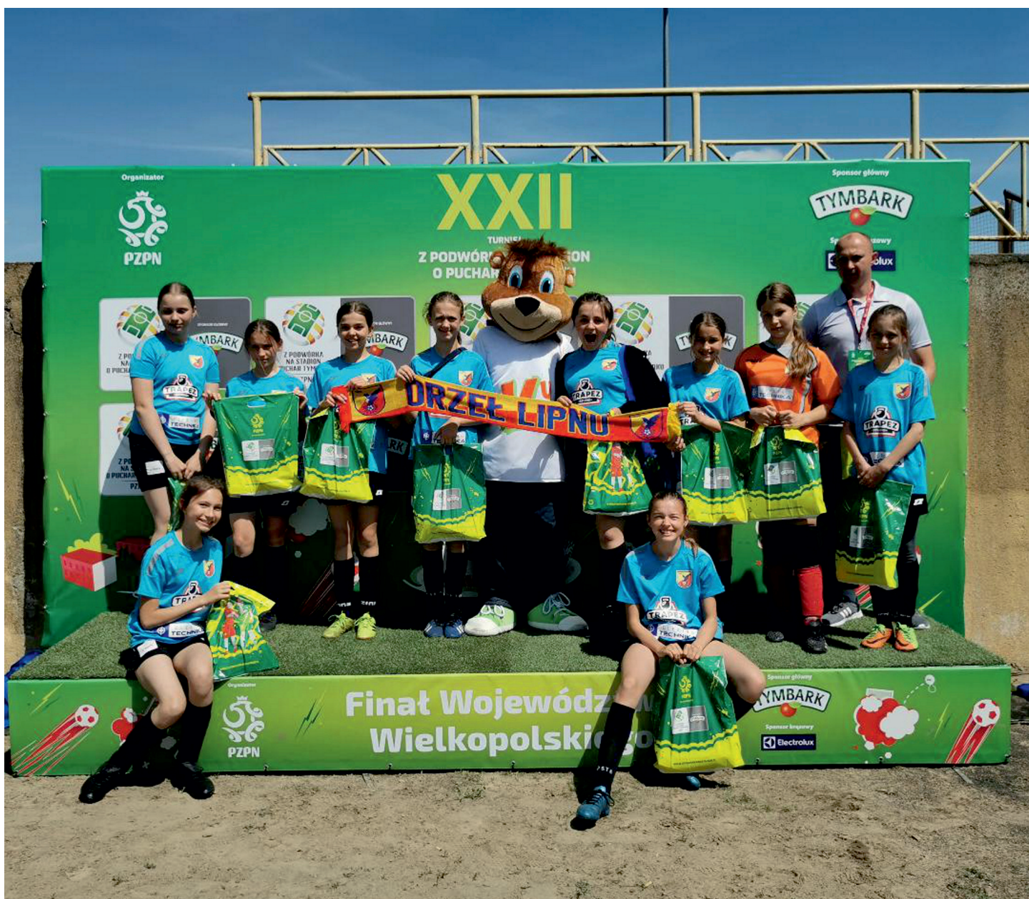
Piłka nożna staje się dyscypliną sportową coraz chętniej uprawianą przez dziewczyny. Sekcja piłkarek działa także w LUKS „Orzeł Lipno”. Dziewczyny z Lipna startowały w turnieju piłkarskim Z PODWÓRKA NA STADION O PUCHAR TYMBARKU rozegranym w Szamotułach.