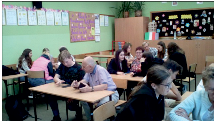
Międzypokoleniowe spotkanie w ramach projektu: „Łączymy pokolenia”.