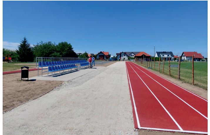
Bieżnia o nawierzchni poliuretanowej.