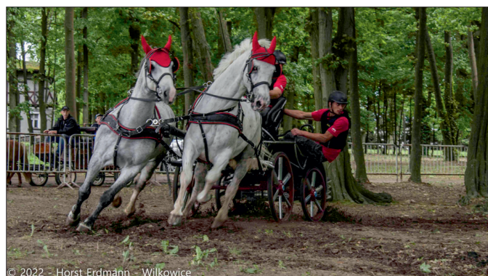
© 2022 - Horst Erdmann - Wilkowice

- 4 września festyn „Dawno, dawno temu na wsi” (or-