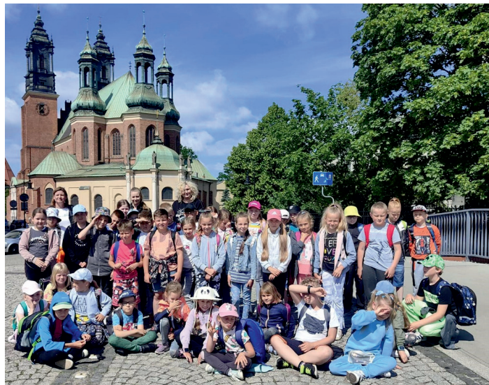
Ostrow Tumski - zwiedzamy najstarszą część Poznania.

Ostatnim punktem naszej wizyty w Poznaniu było zwiedzanie Palmiarni. Palmiarnia Poznańska to największa w kraju i jedna z największych w Europie ekspozycji egzotycznych roślin i ryb. Z największym zaciekawieniem dzieci zwiedziły akwarium z egzotycznymi rybkami oraz pawilon z kaktusami.