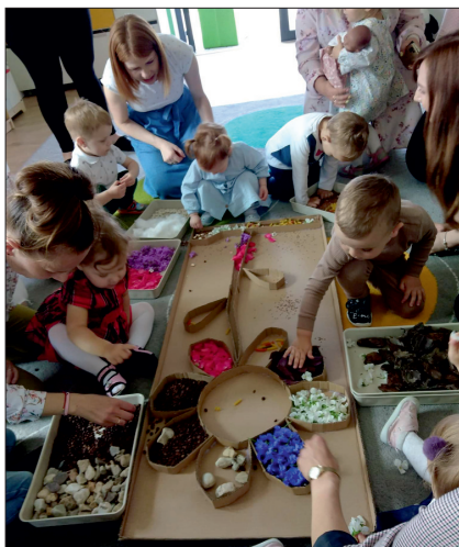
Dzieci układają kwiaty dla mamy.

Dzieci miały również okazję stworzyć wspólną laurkę dla swoich mam podczas warsztatów sensorycznych. Pielęgnowanie tej wspaniałej tradycji od najmłodszych lat umacnia więzi rodzinne oraz utrwała najważniejsze i najpiękniejsze wartości w życiu każdego dziecka. Oby takich