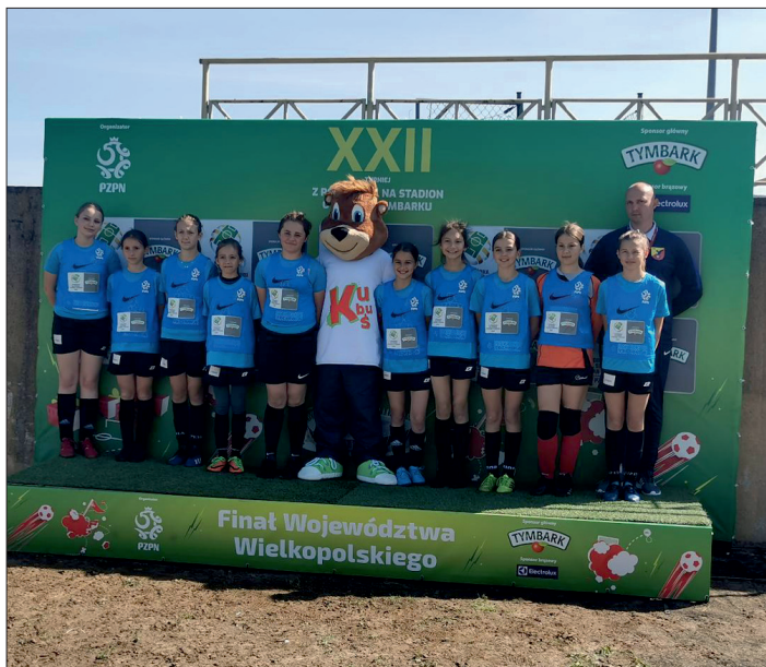
Drużyna piłkarek LUKS „Orzeł Lipno” na zawodach w Szamotułach.