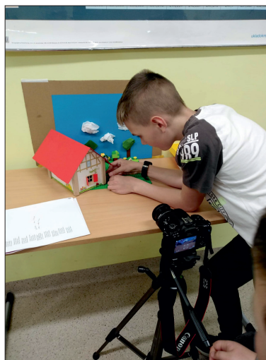
Poezja pobudza zmysły - warsztaty animacji poklatkowej.

Zwieńczeniem projektu będzie wycieczka do Izby Pamięci Marii Konopnickiej w Bronowie. Jest to malowniczy dworek, gdzie przez