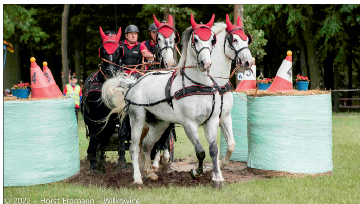
© 2022 - Horst Erdmann - Wilkowice

również nie typowy ponieważ przeszkody sprawnościowe na terenie płaskim były połączone z przeszkodami maratonowymi znajdującymi się w parku. W przerwach czas uprzyjem-