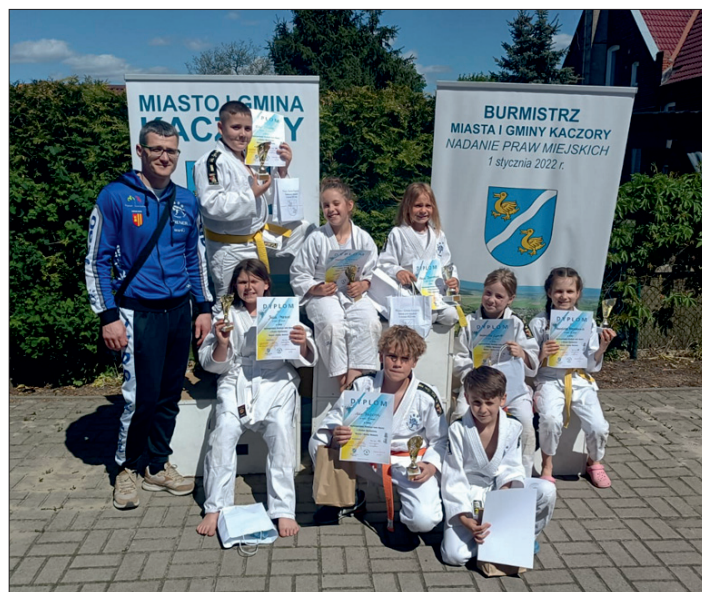
UKS Junior Lipno.