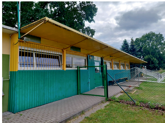
Już niebawem szatnia LUKS „Korona Wilkowice” zmieni swoje oblicze.