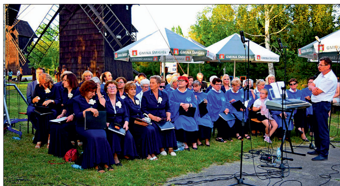
Rapsodia wystąpiła wspólnie z śmigiełskim chórem „Harmonia”.