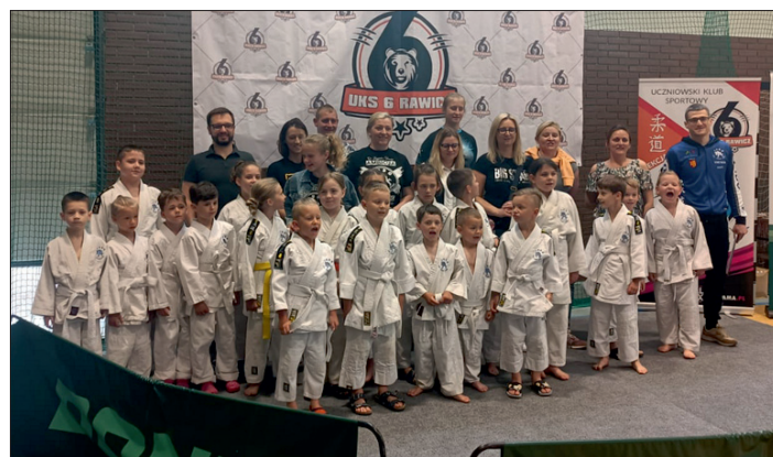
UKS Junior Lipno.