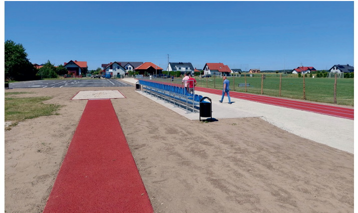
Skocznia do skoku w dal z rozbiegiem o nawierzchni poliuretanowej.