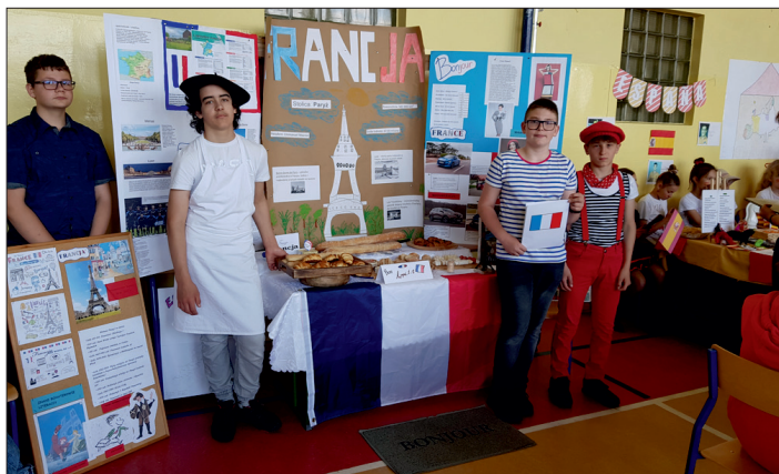
Zwycięzcy konkursu - klasa VIa.

Jury, oceniając poszczególne konkurencje, pod uwagę brało pomysłowość, kreatywność, oryginalność sposobu prezentacji stroju i piosenkarza lub zespołu muzycznego, liczbę i wartość poznawczą