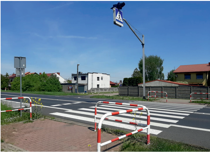
Przejście dla pieszych w drodze wojewódzkiej nr 309 w Lipnie.