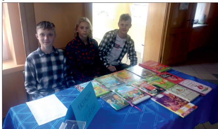
Charytatywny kiermasz książek - „Cegiełka dla Zuzi” w SP w Lipnie.