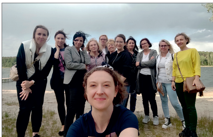
Blisko - szkolenie z Partnerami.

Dofinansowano ze środków Ministra Kultury i Dziedzictwa Narodowego, w ramach realizacji Narodowego Programu Rozwoju Czytelnictwa 2.0. na lata 2021-2025.