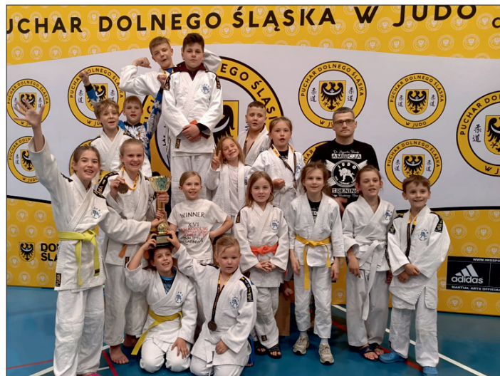
UKS Junior Lipno.