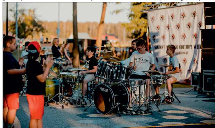
I Gminny Rekord w jednoczesnym graniu na perkusji.

malowanie twarzy, warkoczki i plener malarski. Jednak najważniejszym wydarzeniem tego rock and rollowego dnia był I Gminny Rekord w jednoczesnym graniu na perkusji. Wspólnie z zespołem 9 ich pierwszy singiel Szansa zagrało 13 młodych perkusistów, jeden basista i jeden gitarzysta -