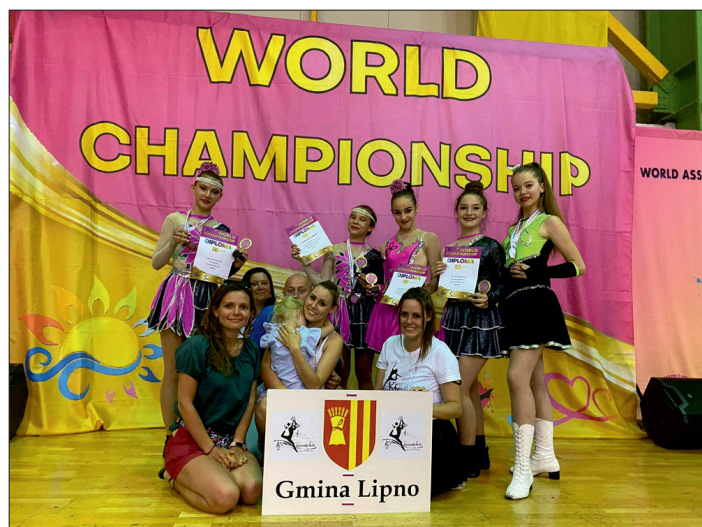
Reprezentanci zespołu mażorettek „Nutki-Lipno” na zawodach w Crikvenicy w Chorwacji.