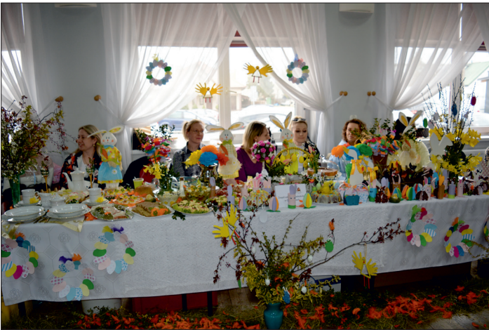
Wielkanoc w Tradycji. Stół ZSP w Goniembicach (szkoła).