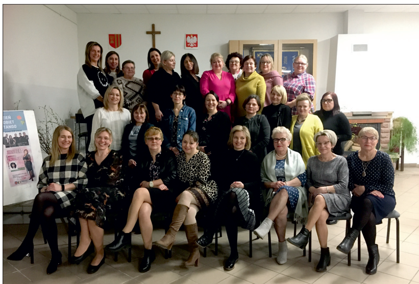
Koło Gospodyń Wiejskich „Aktywny Zakątek”.

Panie z Aktywnego Zakątka sukcesywnie realizują swoje plany i statutowe założe-