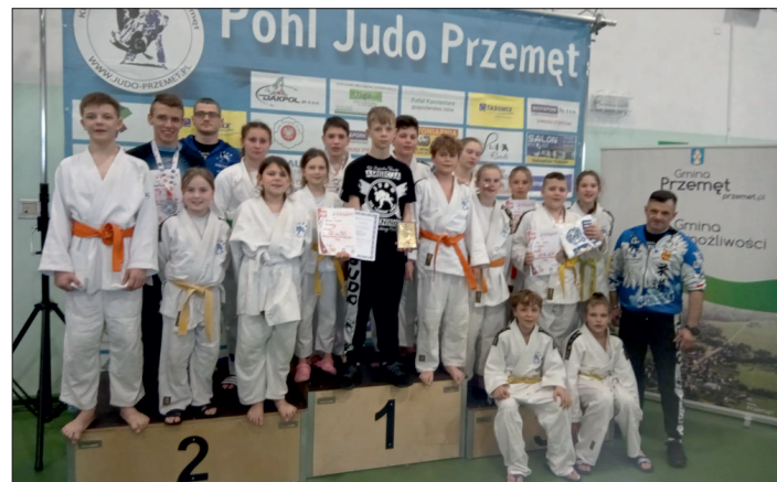
Zawody w Mochach.