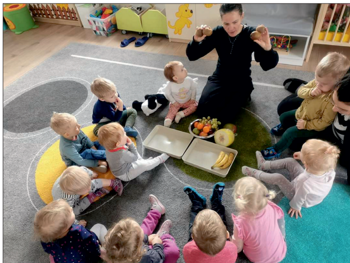
Zajęcia z najmłodszymi.

daktyczny poprzez codzienne prowadzenie zajęć edukacyjnych, dzięki którym rozwijamy zdolności językowe, moto-