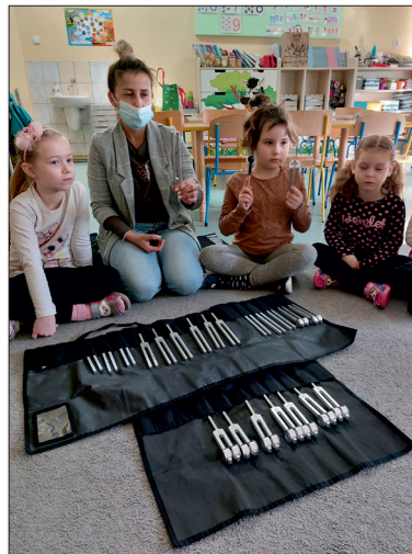
Zajęcia z kamertonami.