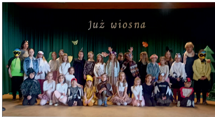
Premiera przedstawienia pt. „Ptasia opowieść o wiosnie”.