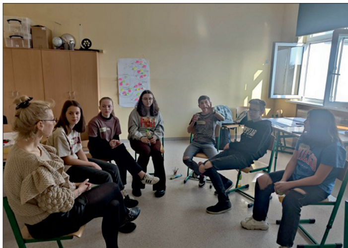
Pierwsze spotkanie w ramach Eksplozji Młodzieżowych Inicjatyw.

czas obchodów Święta Patrona Szkoły. Impreza wzbogacona zostanie o grę terenową, podczas której uczniowie i ich najbliżsi będą poznawali historię