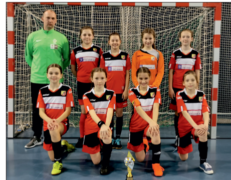
Drużyna „Orzeł Lipno”.