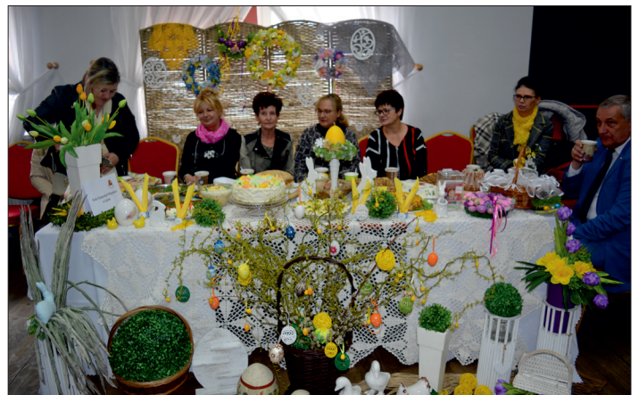
Wielkanoc w Tradycji. Stół Koła Gospodyń Wiejskich w Lipnie.