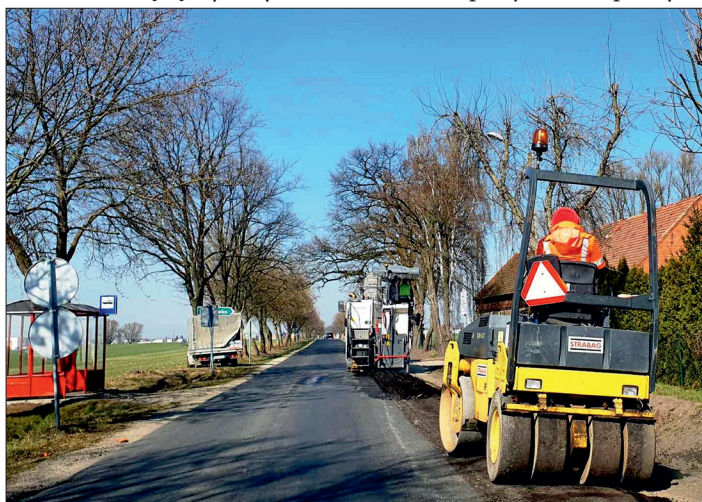
Przebudowa ulicy Mórkowskiej w Wilkowicach.

nie przebudowana, poszerzona i wzmocniona, zbudowane będzie odwodnienie, oświetlenie uliczne, przejścia dla pieszych