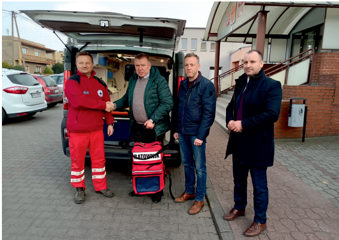
Akcję pomocy dla Ukrainy wsparły władze samorządowe Powiatu Leszczyńskiego i Gminy Lipno.

rękawiczki zwykłe i jałowe, opatrunki zwykłe, hydrożelowe, wentylowe, indywidualne, hemostatyczne, folie ratunkowe, maski i wąsy tlenowe, zestawy do nebulizacji, strzykawki zwykłe w różnych rozmiarach oraz strzykawki do pomp infuzyjnych również w różnych rozmiarach również bursztynowe, igły doszypikowe BIG pediatryczne i dorosłe, nosze pachtowe, zestawy porodowe, filtry tlenowe, rurki ustno-gardłowe w różnych rozmiarach, maski krtaniowe I-Gel w różnych rozmiarach, rurki intubacyjne, cewniki Foleya wraz z workami do moczu, cewniki do ssaka, skalpele jednorazowe, płyny