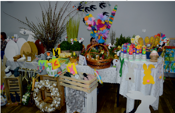
Wielkanoc w Tradycji. Stół ZSP w Lipnie (przedszkole).