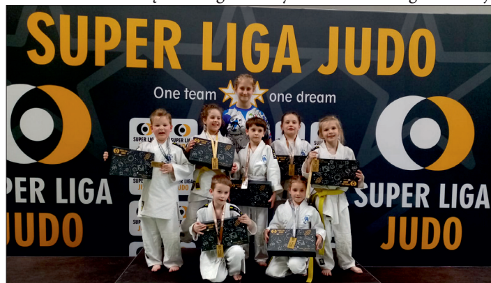
Zawody „Super Liga Judo” w Oleśnicy.

listom, słowa uznania wszystkim startującym i podziękowane, gdyż pokazali charakter i wysokie umiejętności sportowe oraz wielką wolę walki.