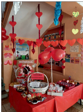
Walentynkowy kiermasz słodkości.