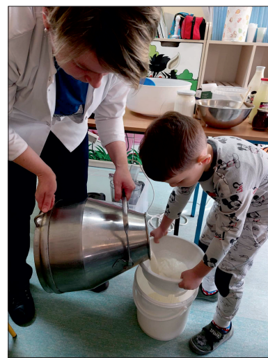
W zajęciach aktywnie brały udział przedszkolaki.