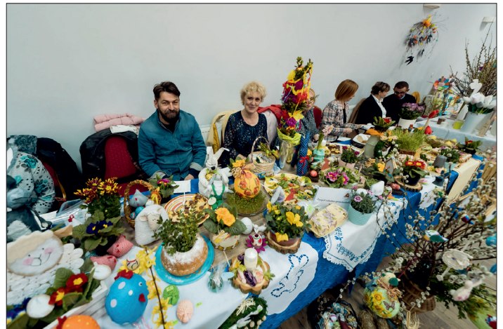
Wielkanoc w Tradycji. Stół ZSP w Lipnie (szkoła).