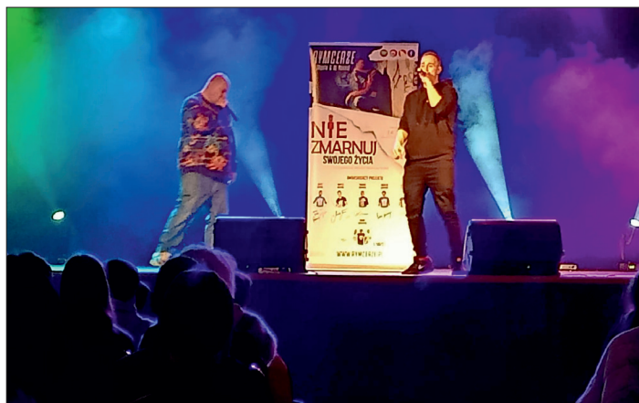
Rymcerze na scenie GOK-u w Lipnie.

wie klas 7 i 8 wszystkich szkół z terenu gminy Lipno wysłuchali historii życia dwóch dorosłych już mężczyzn, którzy wyszli z uzależnienia od alkoholu i narkotyków. W trakcie spotkania padały ostrzeżenia przed stosowaniem używek. Rymcerze namawiali młodzież do bycia sobą, odkrywania swoich pasji i dążenia do spełniania marzeń. Wystąpienia przeplatane były śpiewanymi