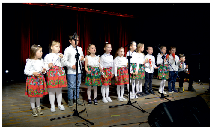
Występ dzieci z Przedszkola w Wilkowicach.