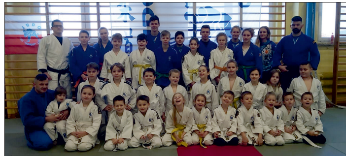
Uczestnicy półkolonii w Lipnie.

Podsumowując półkolonię, dziękuję wszystkim uczestników za pracę treningową i przygotowania podczas półkolonii, na pewno będą tego