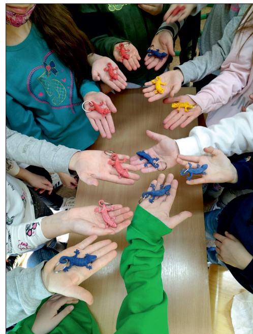
Tak działa drukarka 3D - uczniowie wydrukowali piękne breloczki - krokodylki.

W ramach wyposażenia obligatoryjnego zakupione już zostały: drukarka 3D z akcesoriami, mikro-