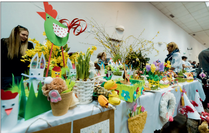
Wielkanoc w Tradycji. Stół ZSP w Goniembicach (przedszkole).