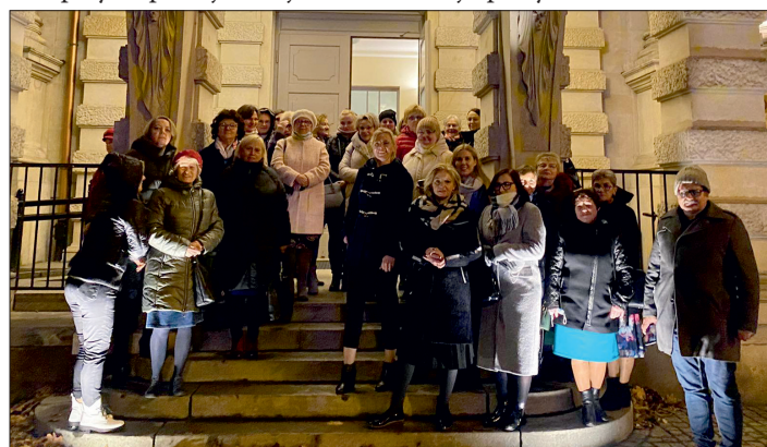
W Teatrze „Komedia” we Wrocławiu.

wie. Odbyły się też warsztaty tworzenia ozdób wielkanocnych. Wykonane prace przeznaczono na świąteczny kiermasz i do prezentacji na przeglądzie Wielkanoc w Tradycji, organizowanym przez GOK w Lipnie. Aktywny Zakątek bierze udział