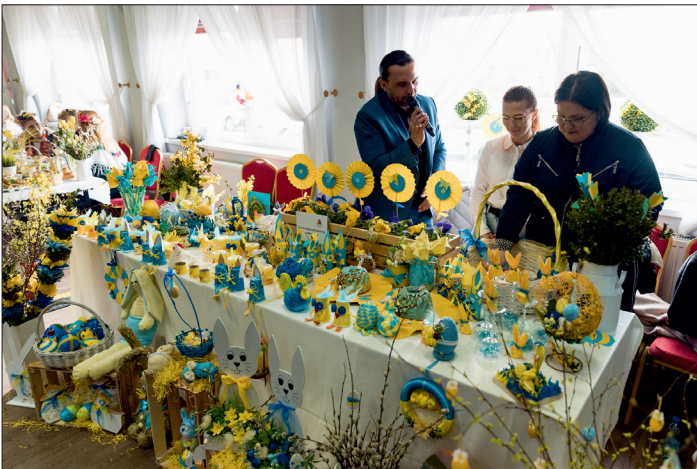
Wielkanoc w Tradycji. Stół ZSP w Wilkowicach.