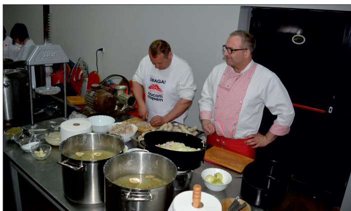
Pokazy wędliniarstwa i degustacja żurku.

także konkursy plastyczne na najładniejszą palmę i pająka wielkanocnego. (red)