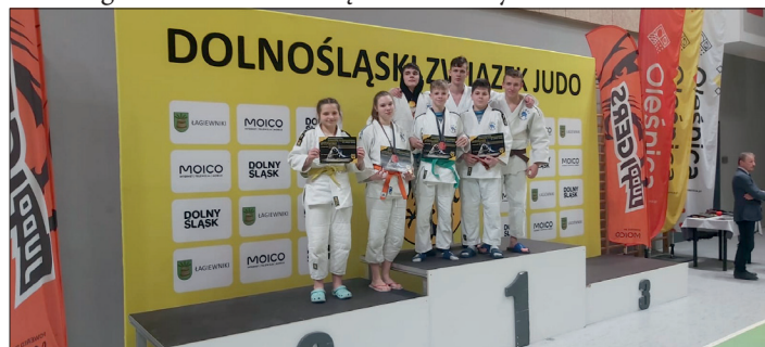
Mistrzostwa Regionu Zachodniego w Oleśnicy.

był spowodowany tym, że prawie wszyscy startujący są najmłodszymi rocznikami w swo-