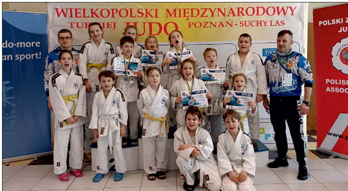
Zawodnicy i trenerzy UKS Junior Lipno na zawodach w Suchym Lesie.