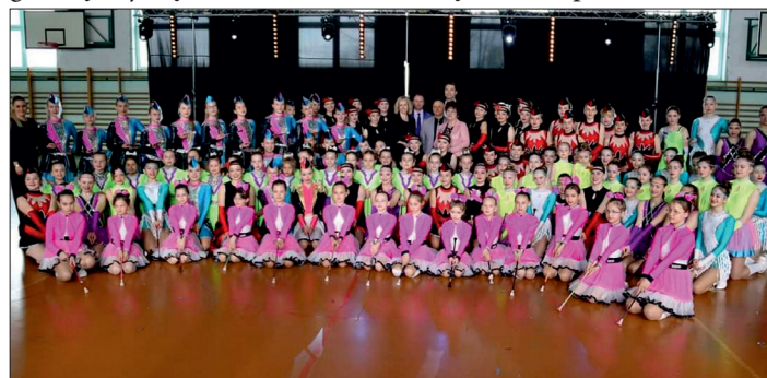
Mażoretkowe Show w Mochach.

Na zakończenie koncertu wręczono statuetki oraz podziękowania przedstawicielom