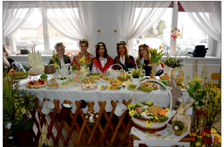
Wielkanoc w Tradycji. Stół Koła Gospodyń Wiejskich „Aktywny zakątek”.